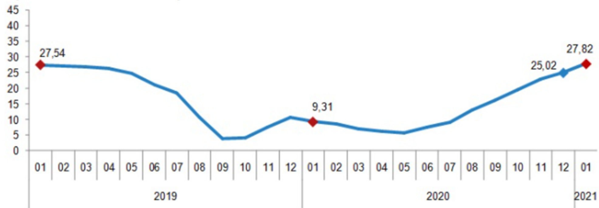
İnşaat maliyet endeksi yıllık değişim oranı (%), Ocak 2021